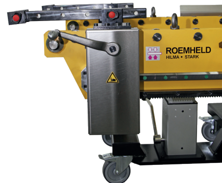
Console pour le changement d'outils avec manivelle et engrenage de transmission